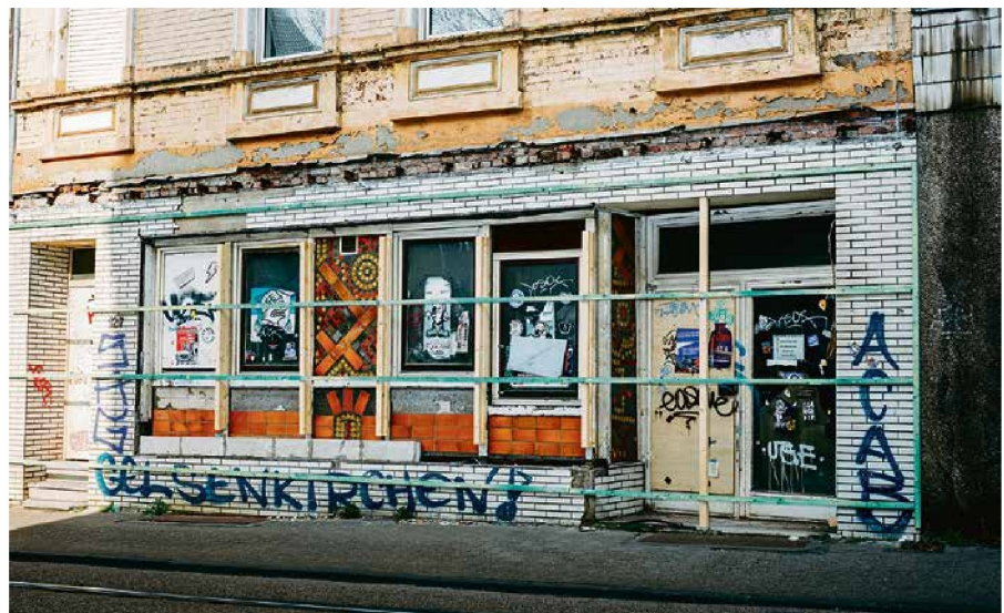
Mehr kaputt als charmant: Verrammeltes Haus in Gelsenkirchen.