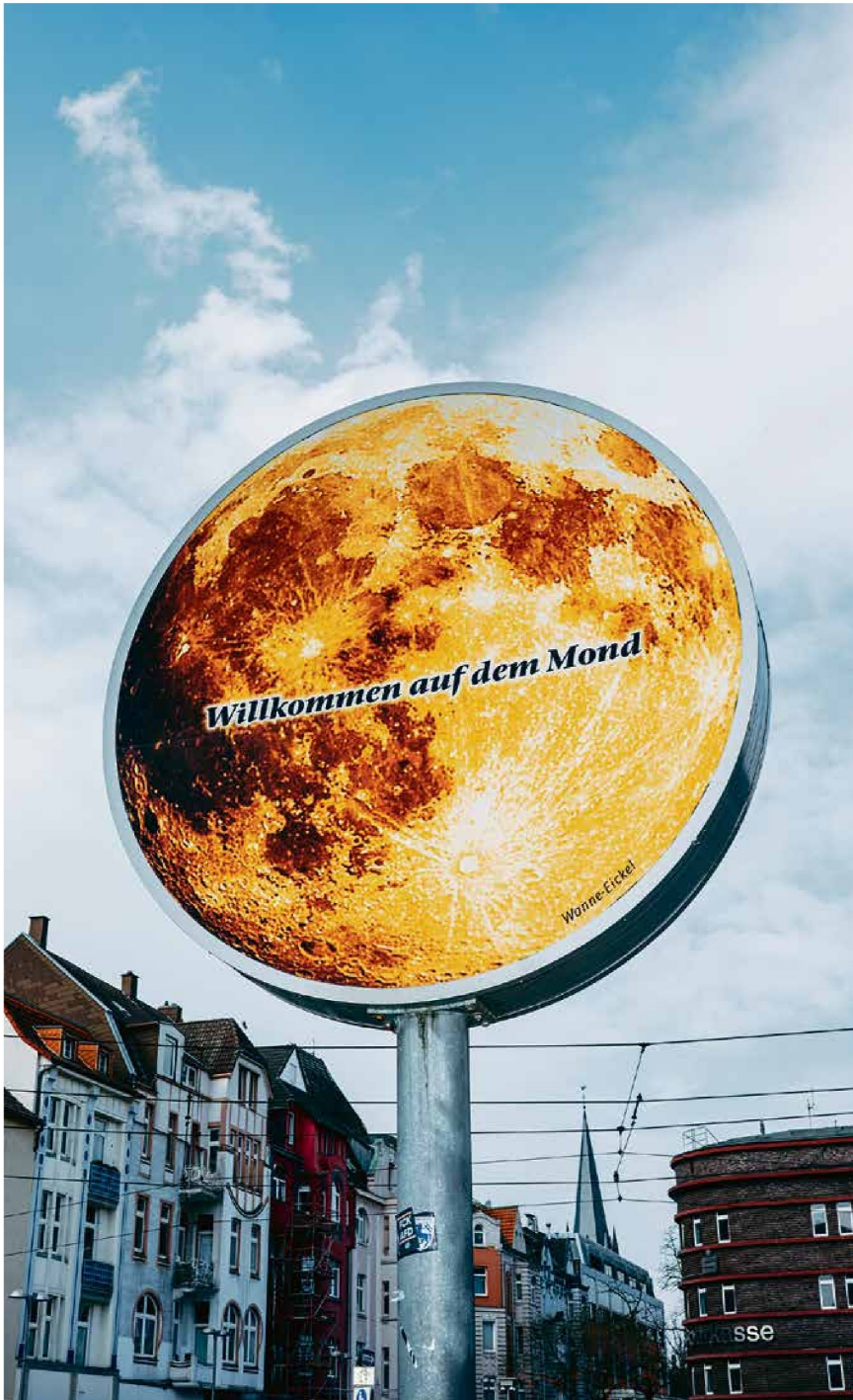
Belächelt, aber stolz: Wanne-Eickel ist etwas heruntergekommen, doch wo der Mond immer voll ist, kann es so schlecht nicht sein.